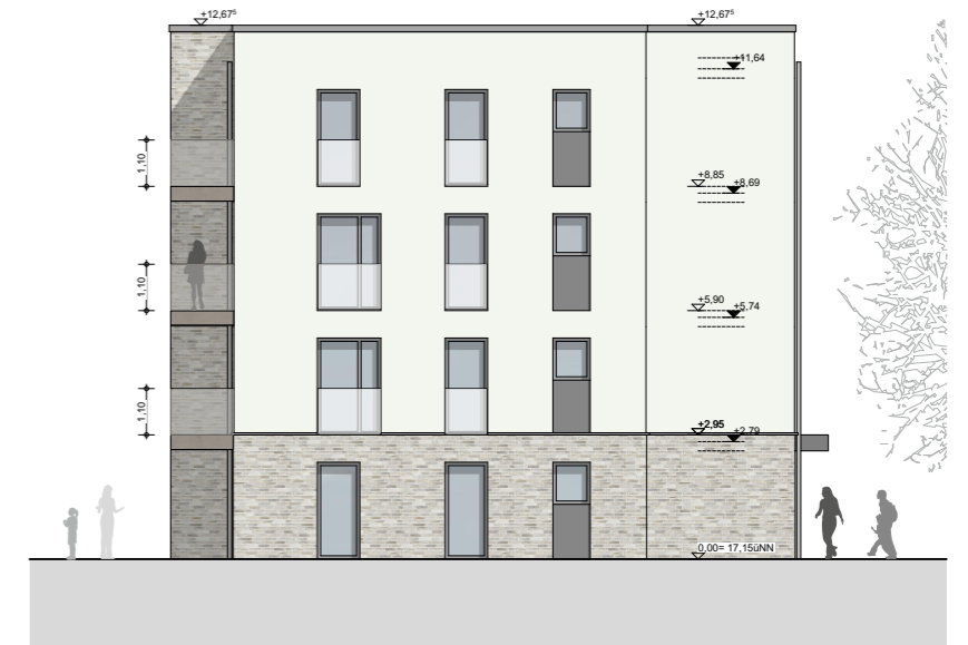
H3.1 Ansicht Nord 1:200