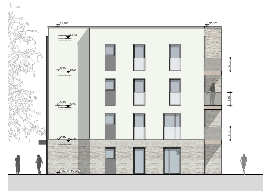
H3.3 Ansicht Süd 1:200